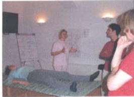
Seminar im Polarity-Center Wien, im Oktober 2003